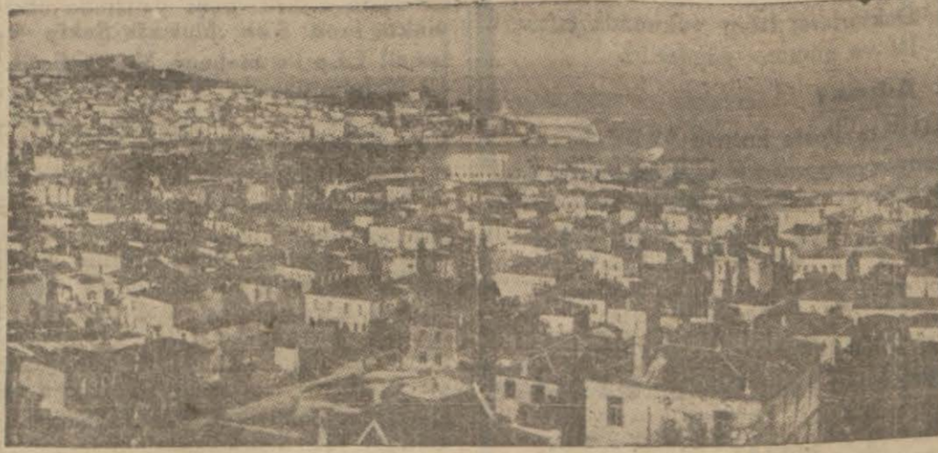
Averofun çıkardığı askerler tarafından işgal edilen Midilli adasının merkezi olan Midilli kasabası

Ustrumada Bir Muharebe Oldu Belgrat 7 (Hususi) — Belgrat