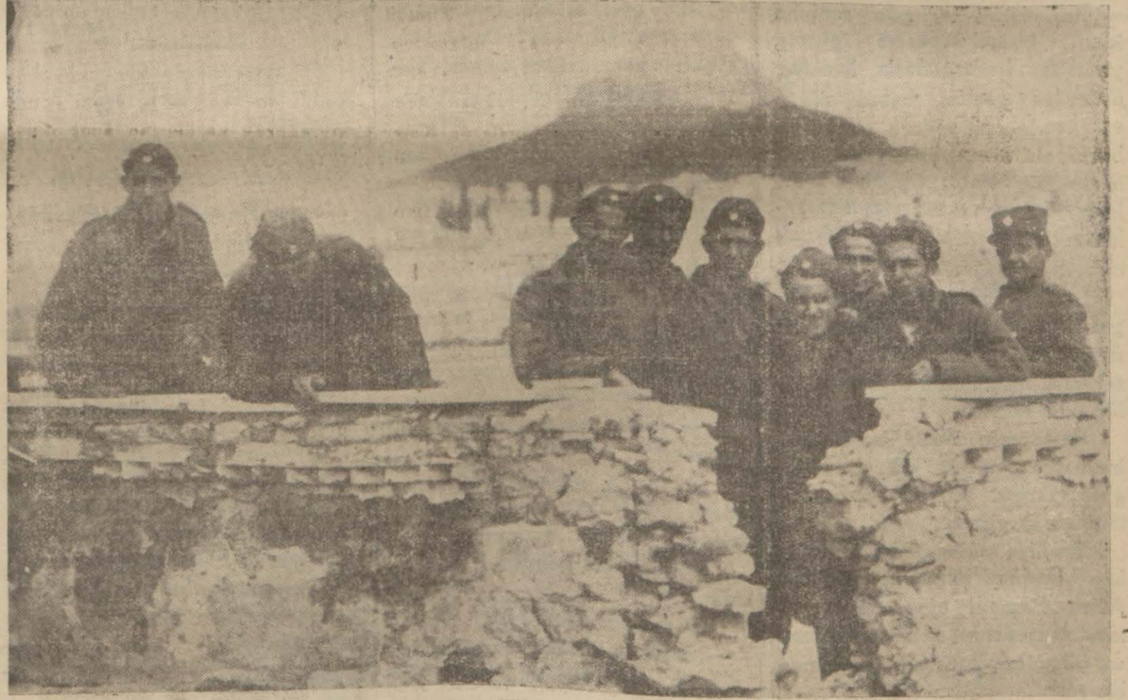
İzmir'in tersane istikamini bomba ile tahrip edildikten sonra