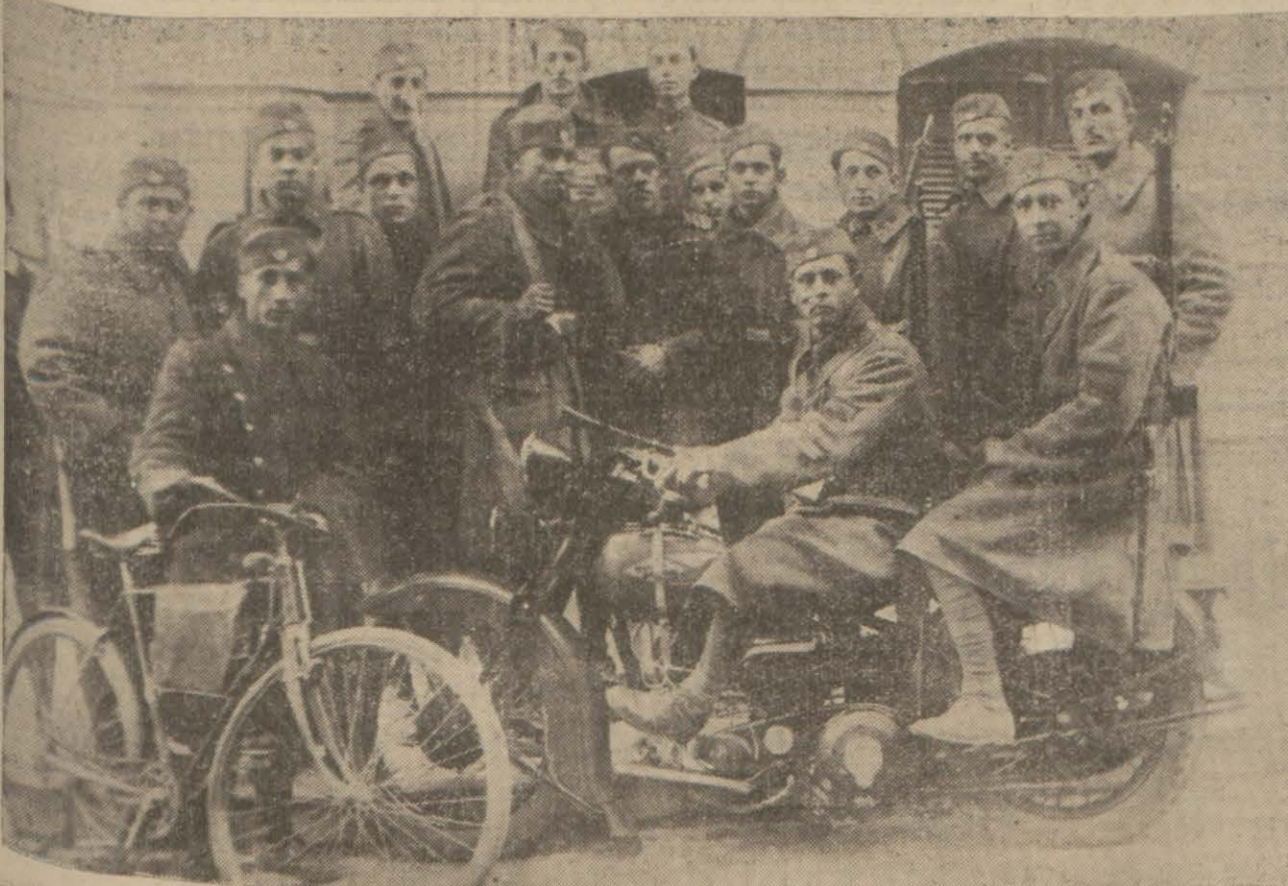
Asilerin Azirine gönderilen askerlerden bir bisikletli piyade müfrezesi